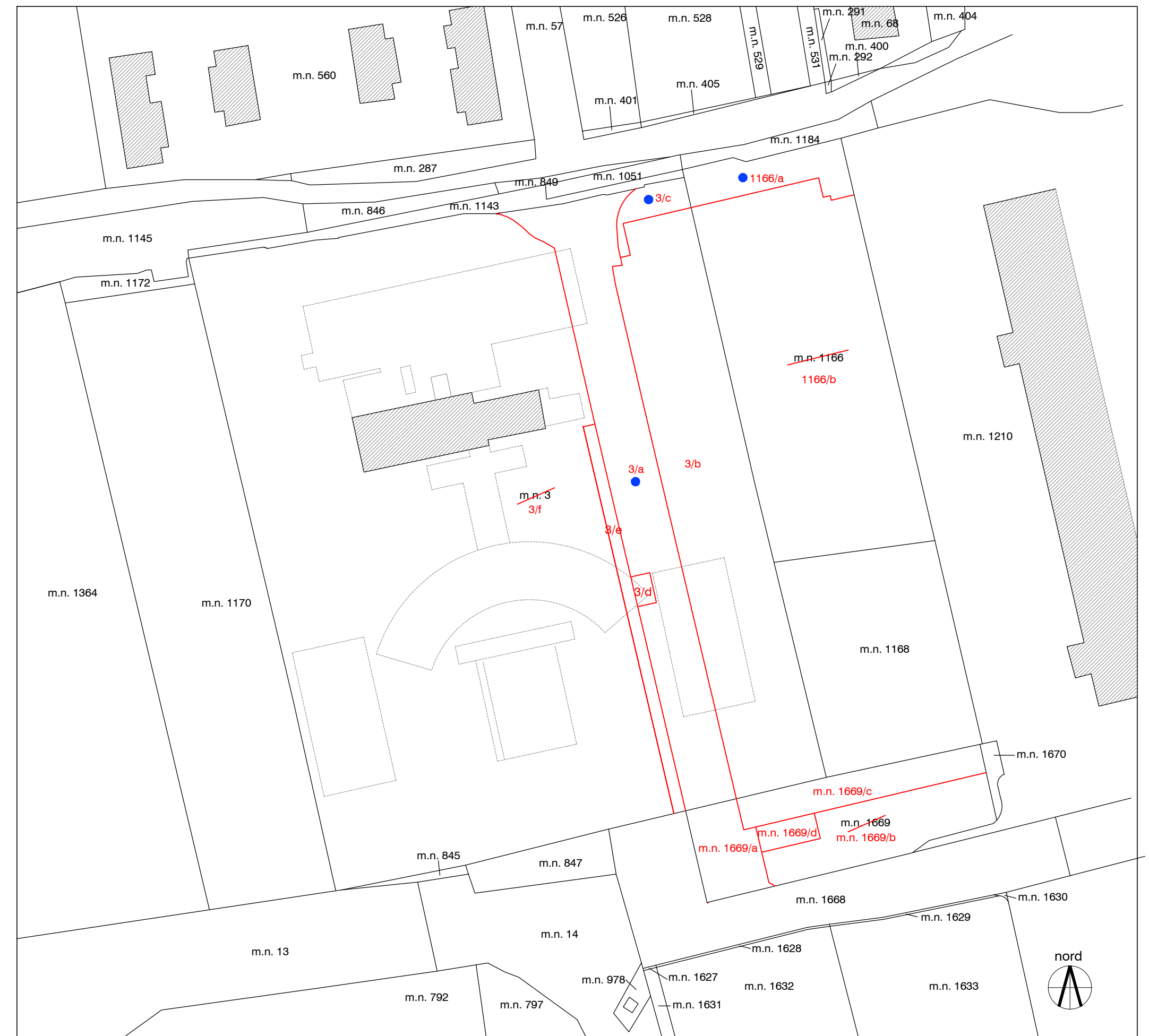
planimetria catastale delle proprietà scala 1:1000