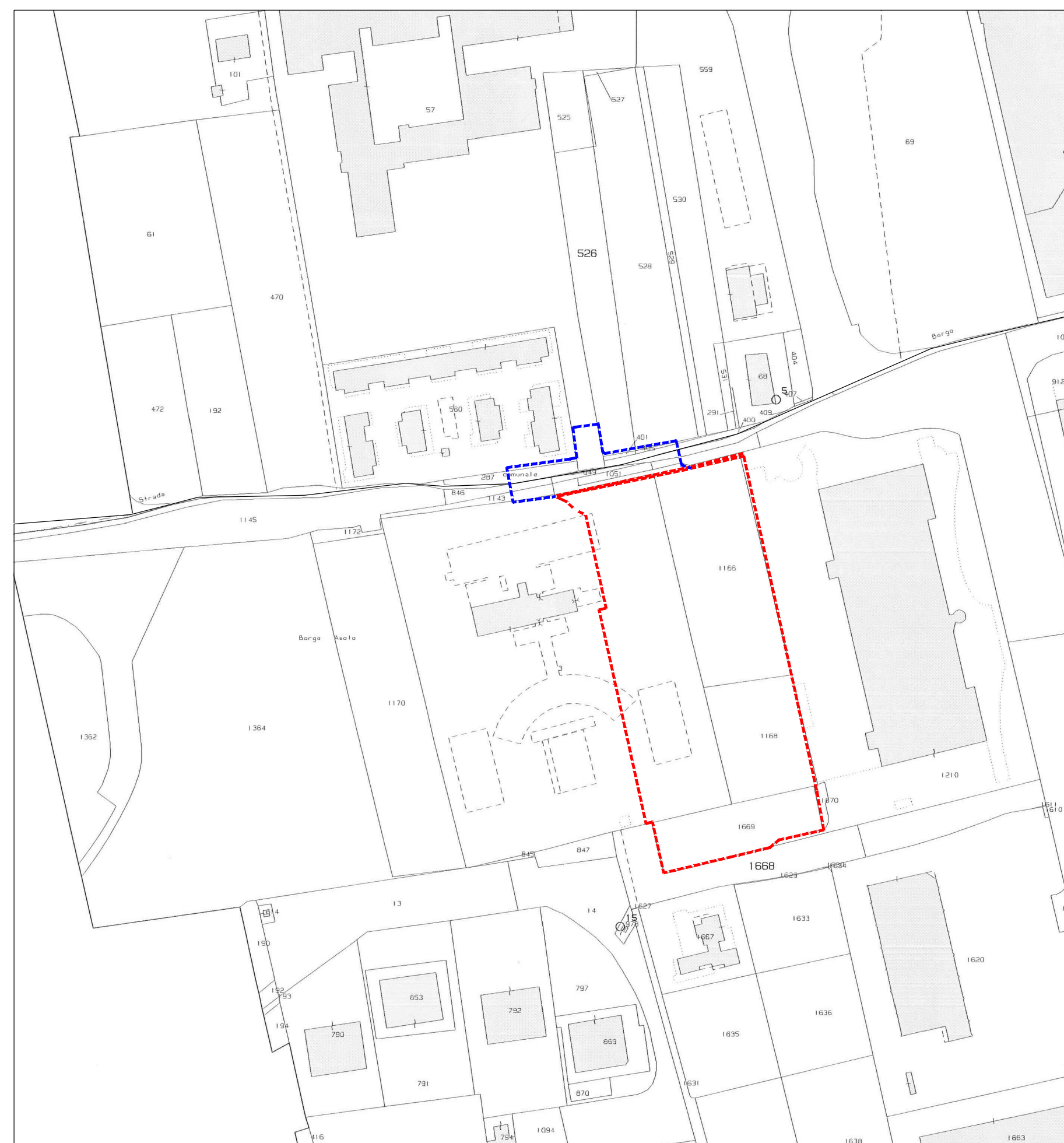
estratto mappa scala 1:2000 - comune di Castelfranco Veneto - foglio 42° e foglio 39°

----- perimetro P.U.A. di progetto ----- perimetro fuori ambito per opere di urbanizzazione