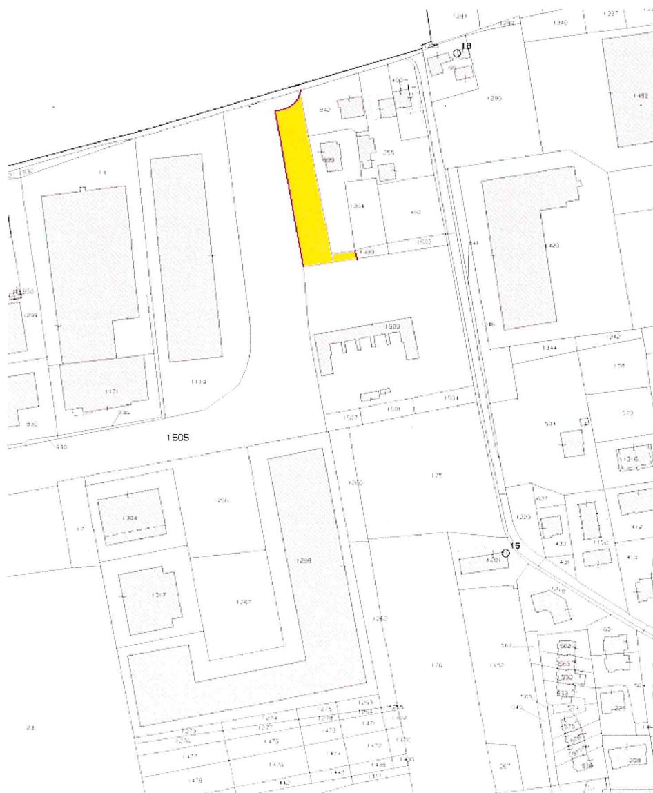
estratto planimetrico non in scala

l'area censita al Catasto Terreni, Foglio n. 50 particella n. 1505 parte: TITOLO VIII - SISTEMA INFRASTRUTTURALE, Strade esistenti e programmate, di cui all'art. 84 delle Norme tecniche Operative del Piano degli Interventi.