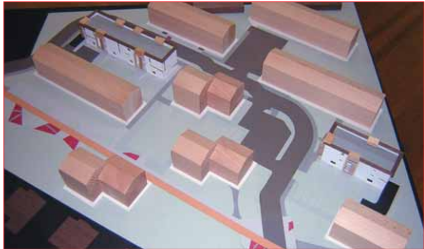
La nuova viabilità nel Quartiere Risorgimento.

Troveranno quindi posto attività associative di vario tipo: spazi per riunioni di gruppi diversi, attività ricreative, culturali, corsi, etc. Potranno essere accostate anche attività di sostegno alle famiglie, per cui ci saranno spazi personalizzati