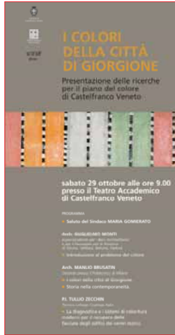
Locandina del convegno di presentazione.

Il lavoro è consistito in una serie di ricerche effettuate sotto il profilo storico su fonti d'archivio, in ricerche diagnostiche sui materiali e sugli intonaci e in un rileva-